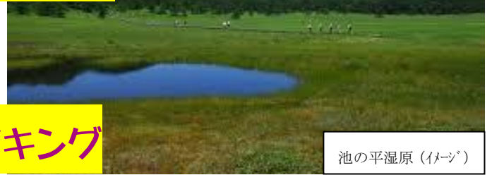
池の平湿原 (イメージ)

■出発日 平成29年9月3日(日)・4日(月)・10日(日)・11日(月)・14日(木)