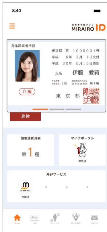
「ミライロID」イメージ