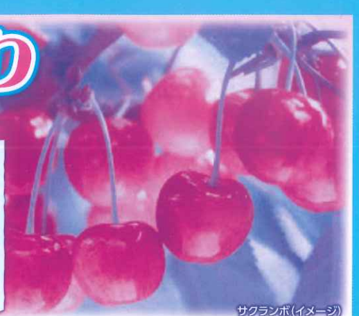
サクランボ(イメージ)

蔵王温泉は強酸性の硫黄泉です。硫黄泉には、体内のムコ多糖タンパクを活性化させる働きがあり、体内水分量を増加させ、肌と血管を若返らせるとされています。また、血行促進効果に加え、硫黄泉には表皮の殺菌作用や皮膚を強くする作用があり、「美肌」も促進！お肌の若返りと美肌効果はまさに「美人づくりの湯！」お食事もお楽しみの一つです。今回は1泊4食付きのご案内です。2日間素敵な旅をお過ごしください。