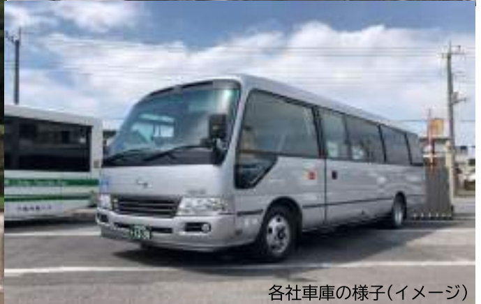
各社車庫の様子(イメージ)