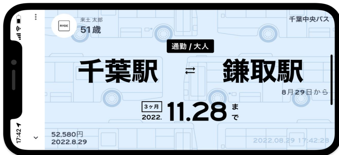
定期券面のイメージ

千葉中央バスでは、今後もお客様の利便性向上に努め、地域の皆さまの豊かな暮らしの創出に貢献して参ります。