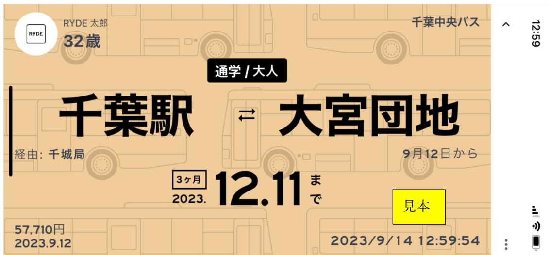
定期券面のイメージ

千葉中央バスでは、今後もお客様の利便性向上に努め、地域の皆さまの豊かな暮らしの創出に貢献して参ります。